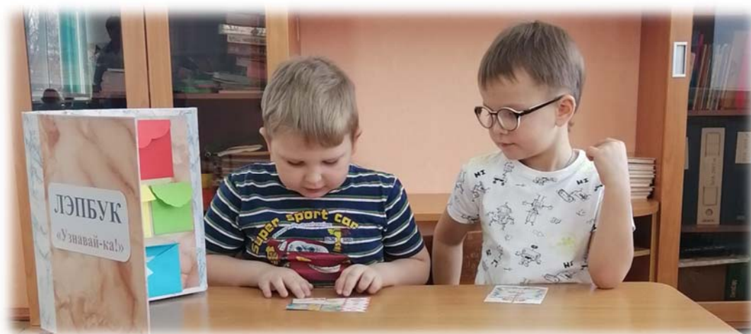
Ди «Разрезные картинки, символы Сеченовского района»