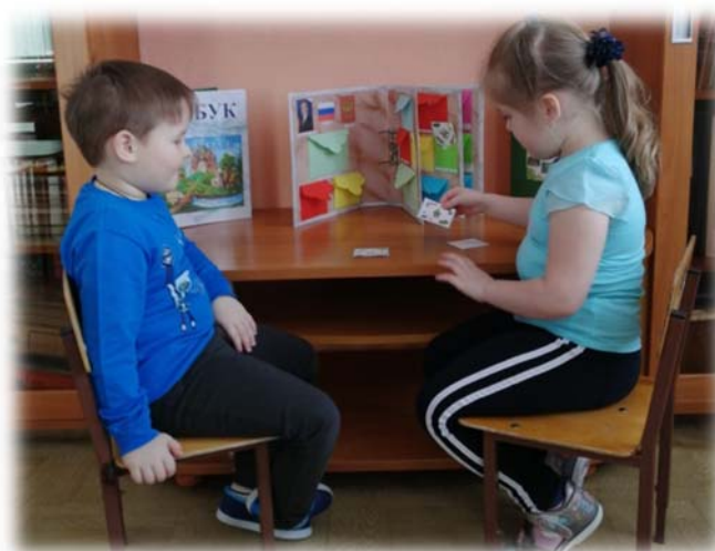
Ди «Назови профессию»