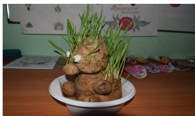
Травяник на 14 день